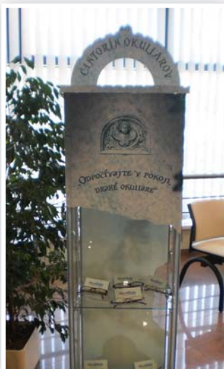
Cintorín okuliarov v NeoVízii.

Rozmýšľate, kam si po operácii odložíte svoje dioptrické oku-